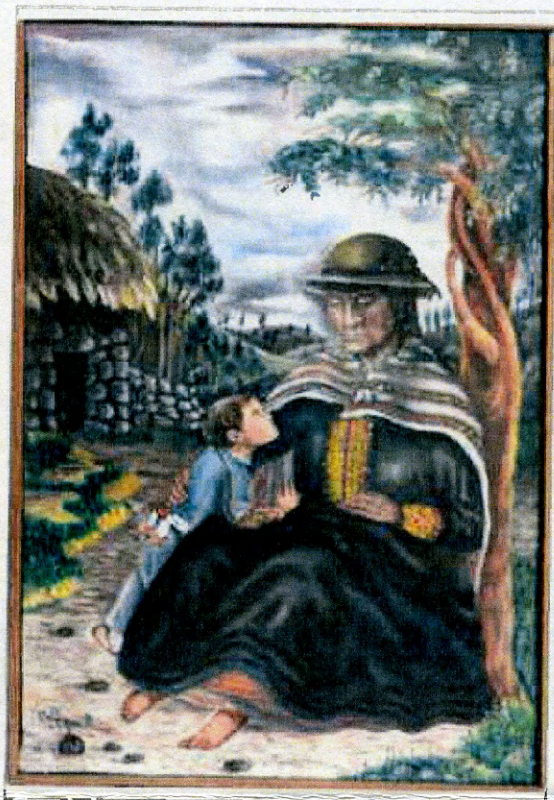
Imágen: Vista anterior