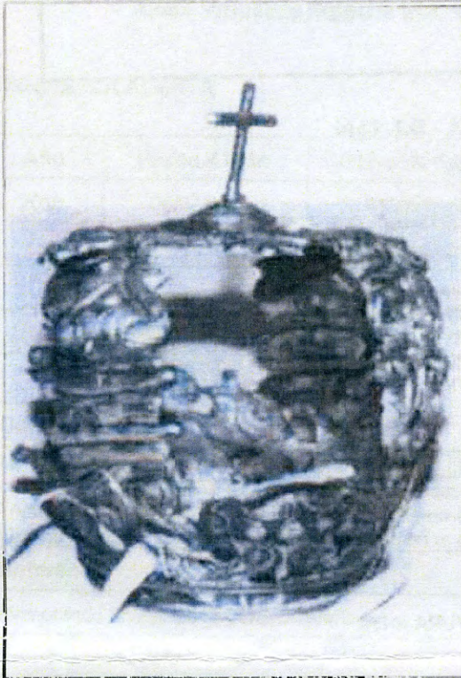
Imágen: Vista General