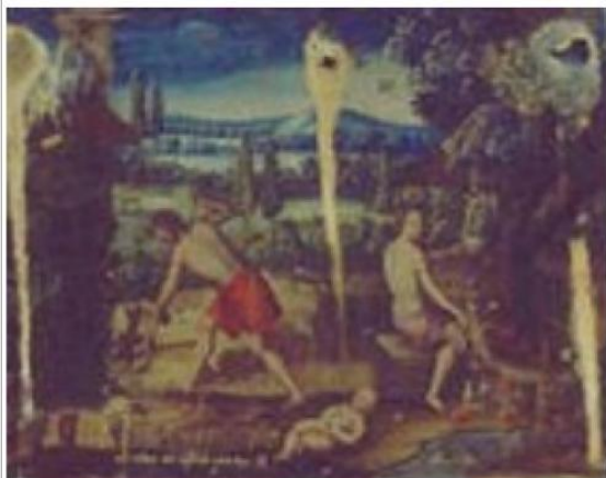
Imágen: Vista General