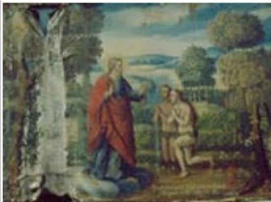
Imágen: Vista General