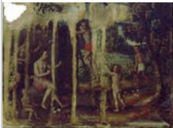
Imágen: Vista General