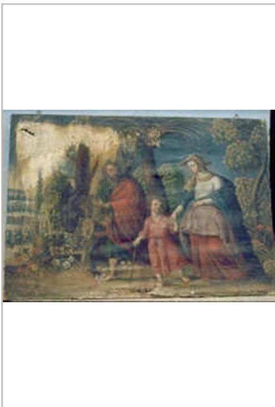
Imágen: Vista General