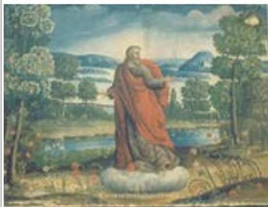
Imágen: Vista General