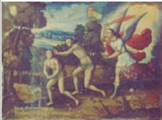
Imágen: Vista General