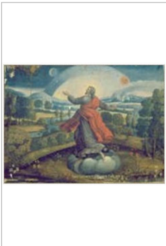
Imágen: Vista General