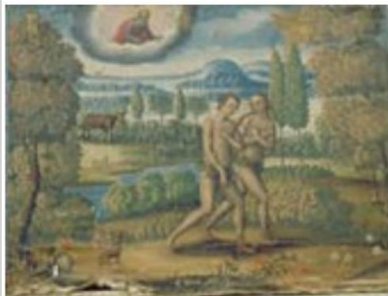
Imágen: Vista General