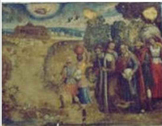
Imágen: Vista General