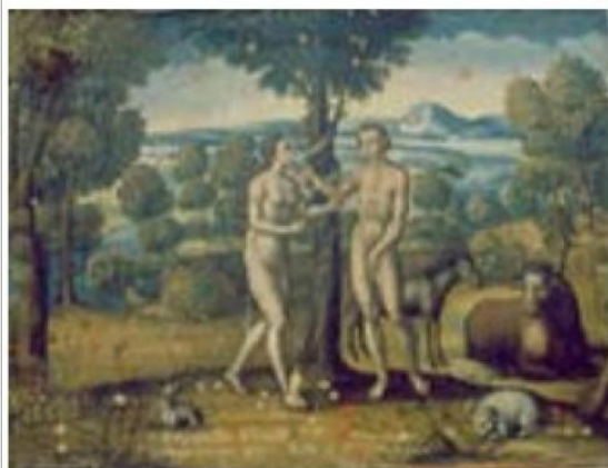
Imágen: Vista General