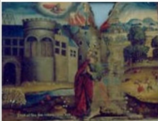
Imágen: Vista General