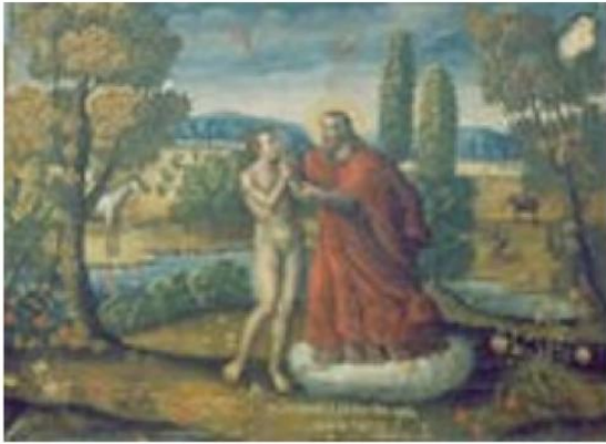
Imágen: Vista General