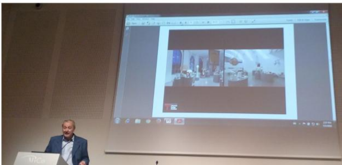
(Foto: z přednášky Arturo Dell'Acqua Bellavitis, prezidenta Triennale Design Museum)

CIDOC – 16:00-18:00 Introduction to Documentation Standards