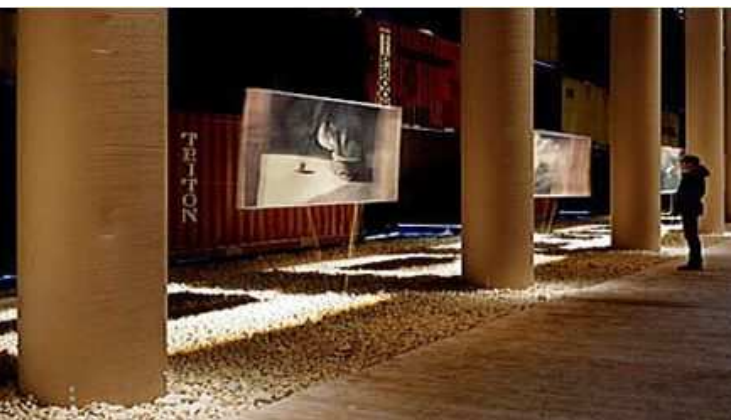
Koncertní síň v Aquile, Itálie, 2011