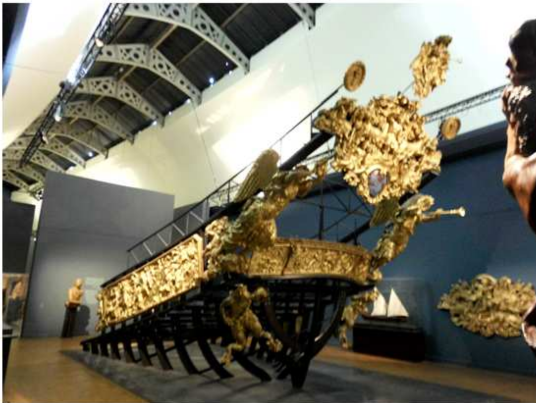
Musée national de la Marine – prezentace výzdoby lodí