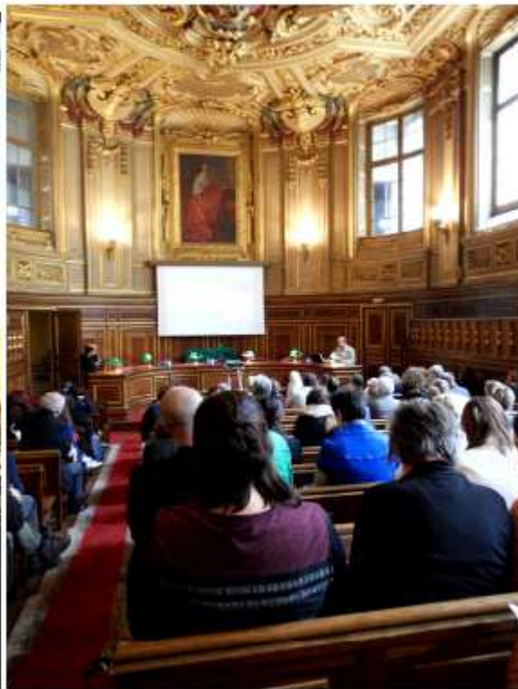
Dopolední přednáška v historickém Sorbonny