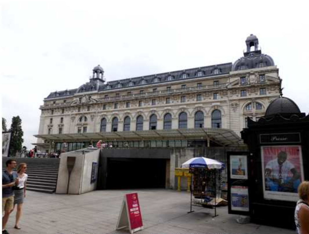
Musée d'Orsay, budova bývalého nádraží