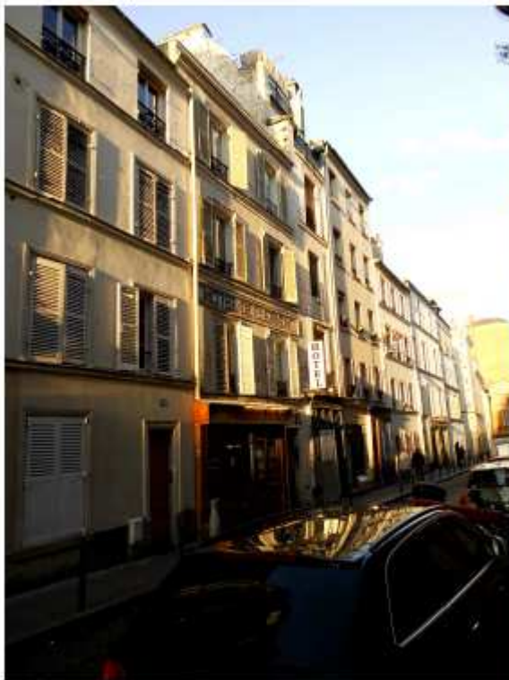
Grand Hotel Clermont sále pařížské