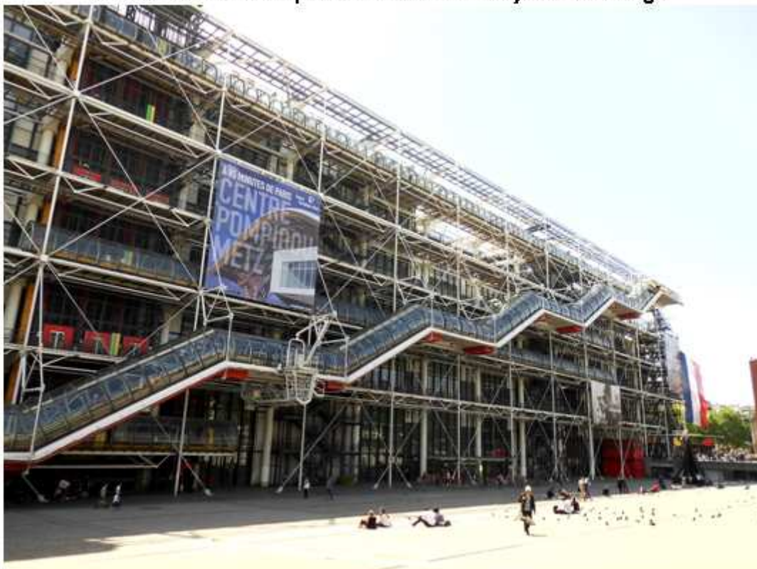
Industriální architektura Centre de Pompidou