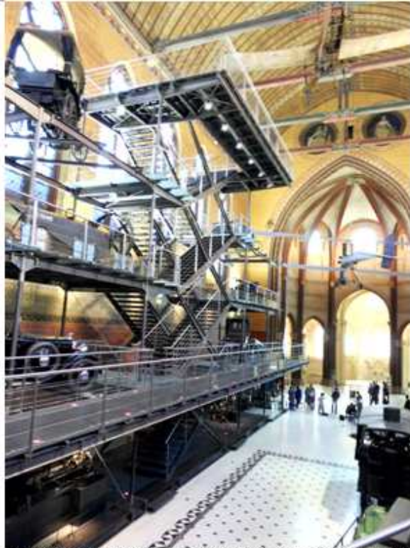
Musée des Arts et Métiers – instalace v bazilice Ming Pei