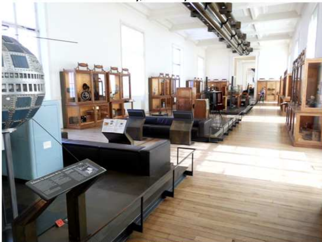
Vhled do expozice Musée des Arts et Métiers