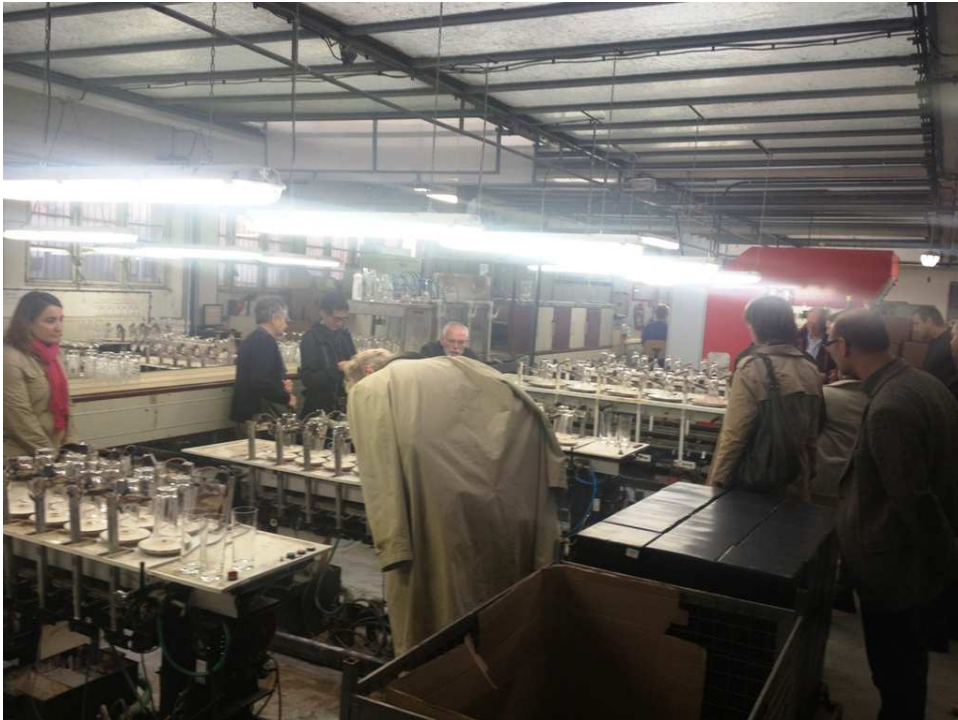
Exkurze do sklárny RONA, Lednické Rovné