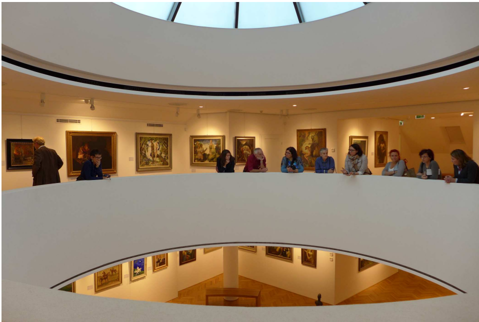
Galéria Nedbalka, Bratislava