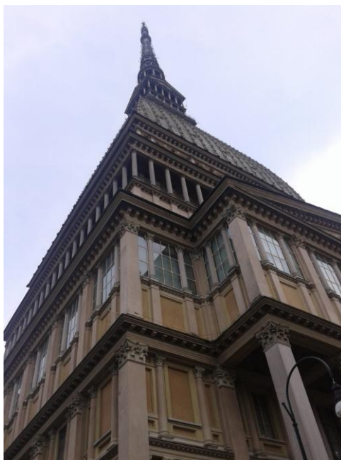
Obr. 2: La Mole Antonelliana, Museo Nazionale del Cinema