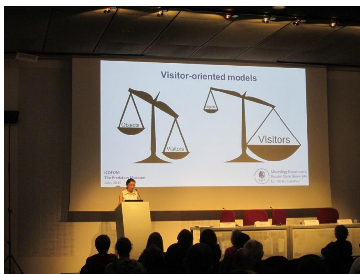
Obr. 1: Přednáška Anny Leschenko Conscious Museum