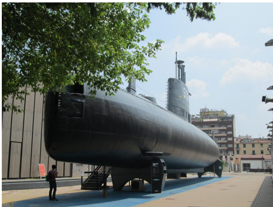
Obr. 5: Museo Nazionale Scienza e Tecnologia Leonardo da Vinci (exteriérová expozice)