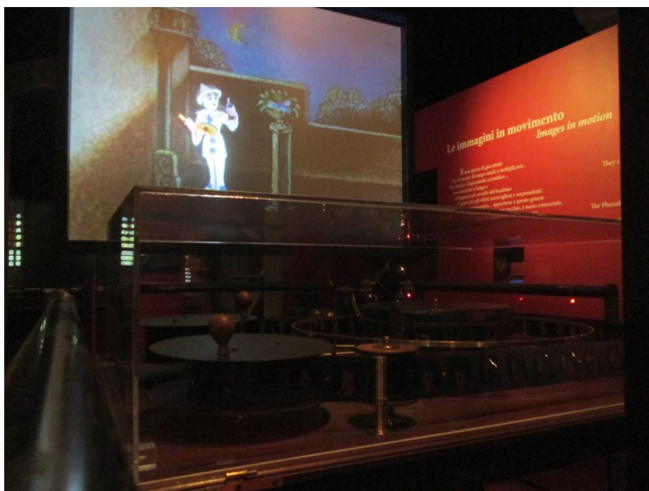
Obr. 3: Museo Nazionale del Cinema, replika projekčního praxinoskopu Emile Reynauda