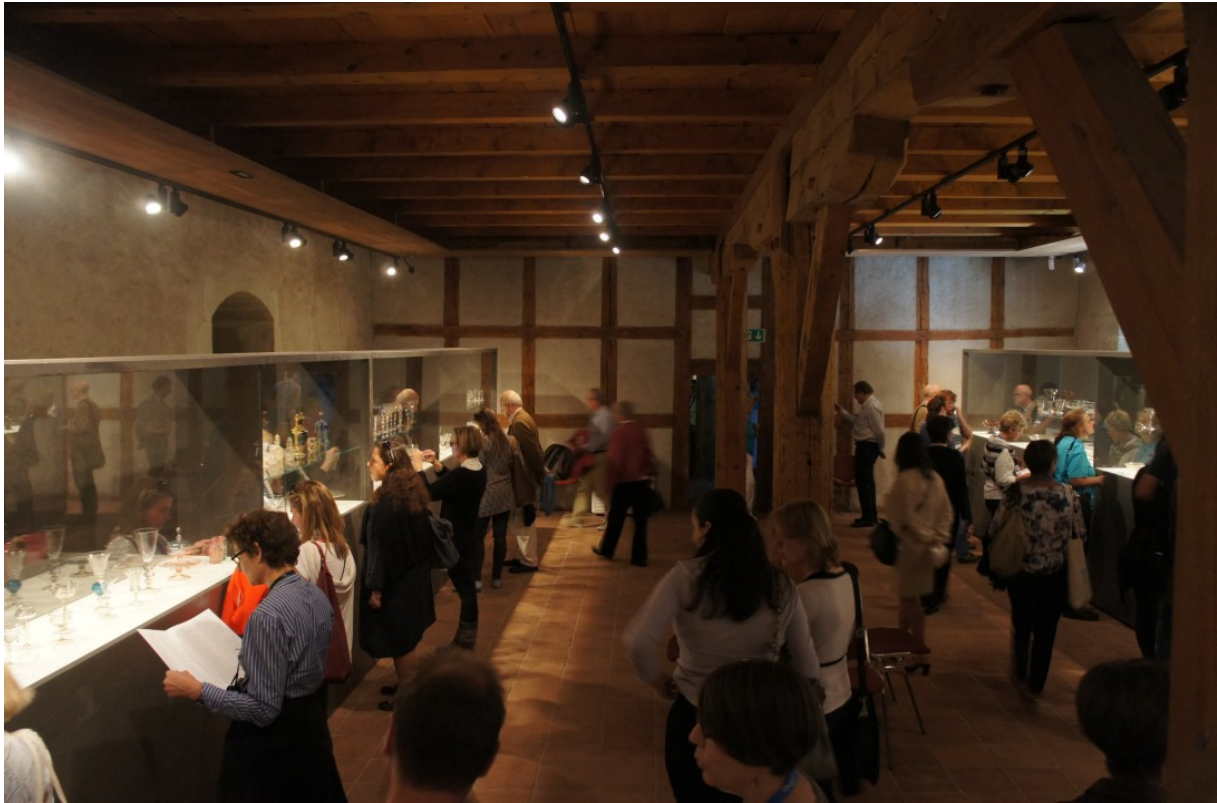
Prohlídka výstavy benátského skla, Vitromusée, Romont