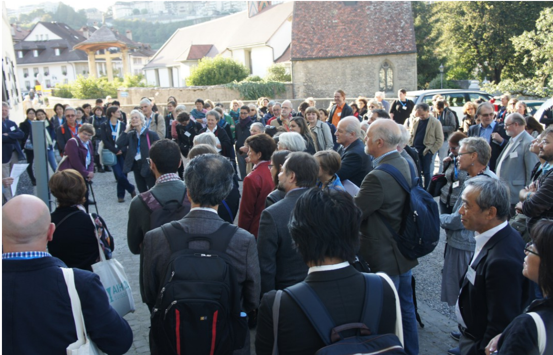
Fribourg, účastníci konference AIHV / ICOM Glass ze všech koutů světa před Service archéologique de l'Etat de Fribourg