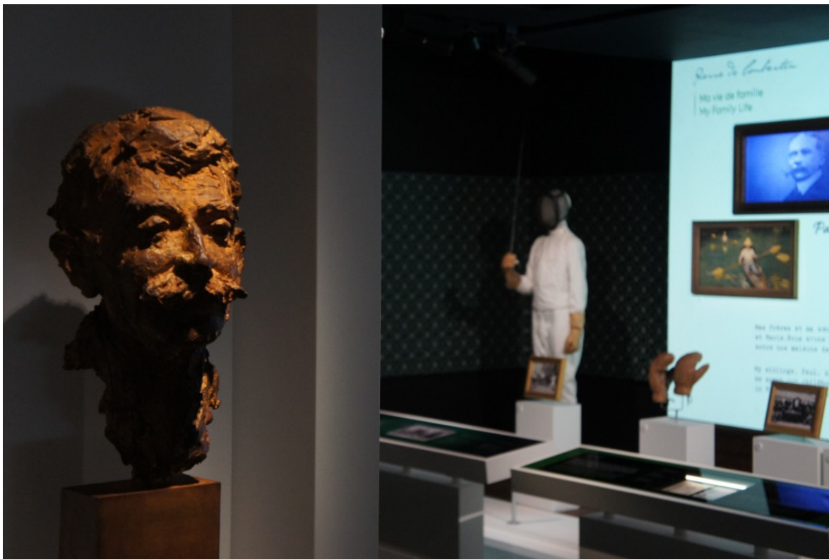
Le Musée Olympique, Lausanne, Pierre de Coubertin