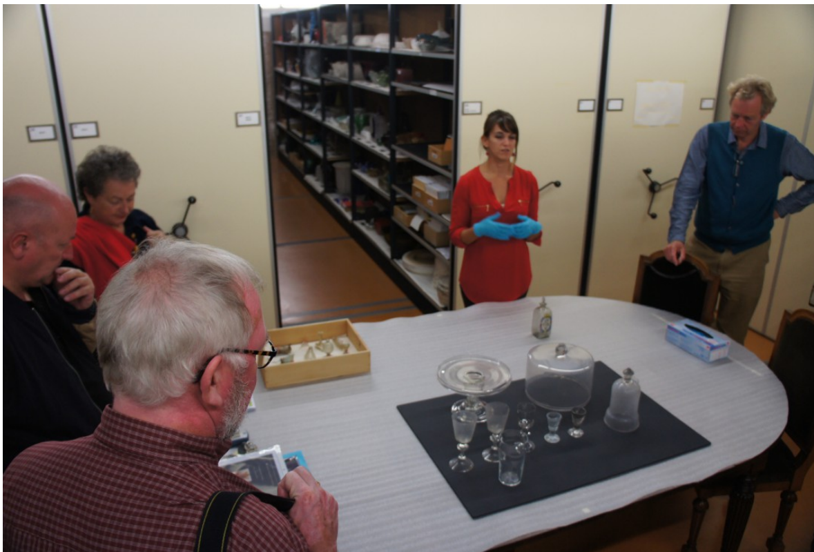
Musée Ariana, Ženeva, prohlídka depozitářů